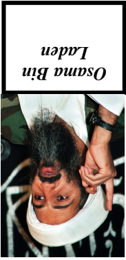
Osama Bin Laden