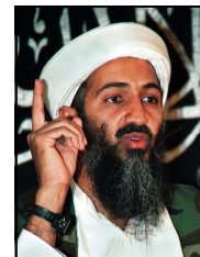
Osama Bin Laden

From 2001 to 2011, bin Laden was a major target of the War on Terror , as the FBI placed a $25 million bounty on him in their search for him . On May 2, 2011, bin Laden was shot and killed inside a private residential compound in Abbottabad , Pakistan, by members of the United States Naval Special Warfare Development Group and Central Intelligence Agency operatives in a covert operation ordered by United States President Barack Obama .