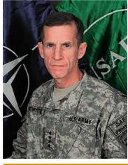
General Stanley McChrystal