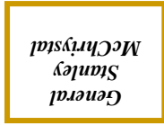
General Stanley McChrystal