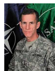
General Stanley McChrystal