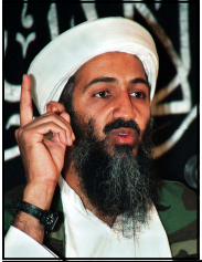
Osama Bin Laden